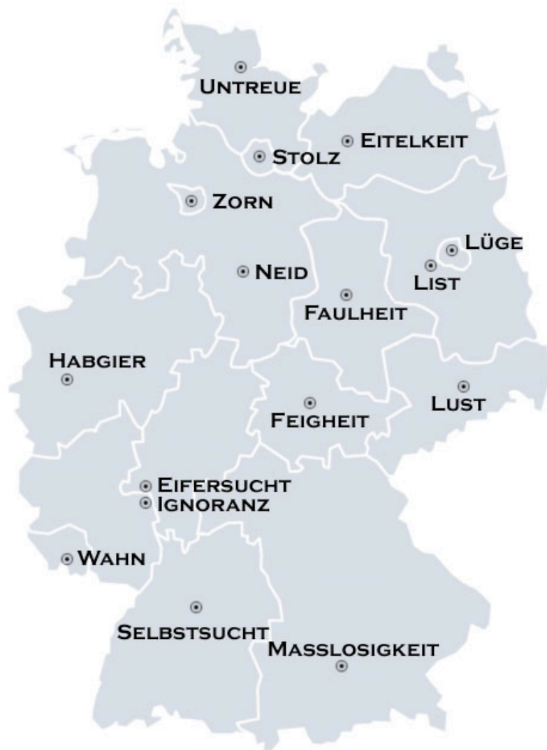
German capital sins

Die Hoffnung stirbt zuletzt... Aber nicht für lange und nicht für immer ;-)